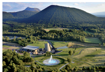
Parc ludique et scientifique : Vulcania

Pensez à vous inscrire aux activités à l'avance. Certaines activités ont un nombre de places limité.