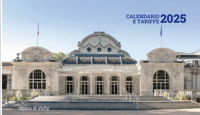
Opera di Vichy